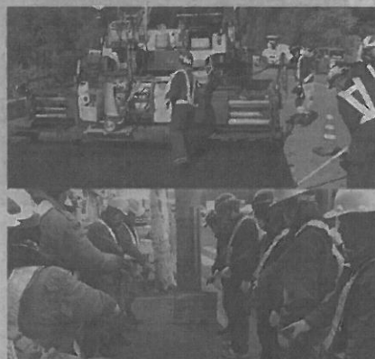
火気を扱わないことで現場環境が改善

は依然昔のまま。今までの業界の当たり前を見直し、作業環境の改善と効率化を図れないか。そんなとき、道路を保護するマスキングテープを見て、「両面テープを接着剤の代わりに使ってみよう！」とひらめいたんです。