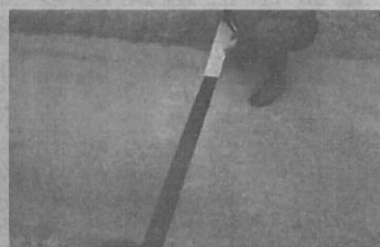
アステープを使用した舗装工事

の危険性には大きな衝撃を受けました。土木工事の機械や技術はほとんど進歩しているのに、工事方法そのもの